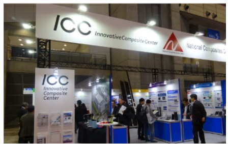
IPF Japan 2017へのHACM企業の合同出展