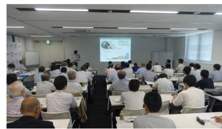
関西FRPフォーラムとの合同フォーラム開催