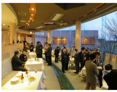
勉強会後の懇親会