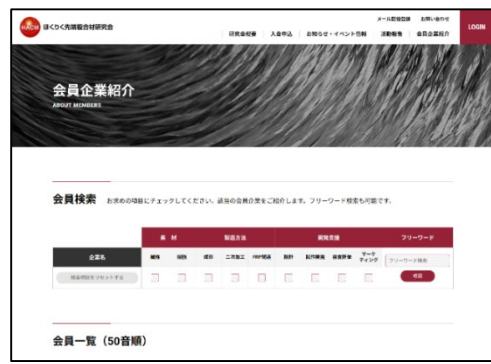
会員企業 検索ページ