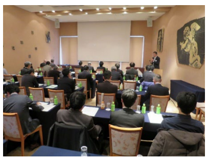
2019年3月1日会員限定勉強会