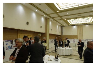
HACM会員企業、ICCメンバー企業ポスターを展示した会場での交流会