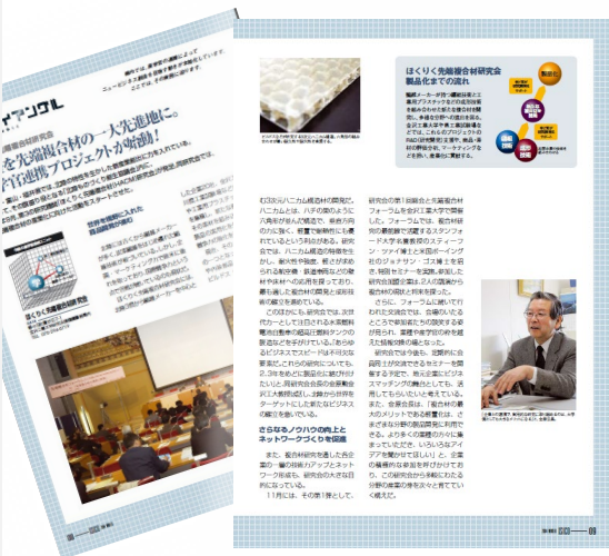
「北陸を先端複合材の一大先進地に／産学官連携プロジェクトが始動！」 “ISICO” Vol.22（2004 Winter）

【設立理念】 ほくりく先端複合材研究会（以下「研究会」という。）は北陸地域の企業に蓄積された基礎技術と応用技術の合理的な協調による研究開発を進めることで 先端的複合材の産業化 を目指し、その活動を通して同地域の企業の技術開発力を高め、もって同地域の複合材に関する産業が世界における先導的な地位を獲得し国際競争力を高めるよう支援する。 2. 研究会は複合材料技術が材料技術にとどまらず、 関連する技術分野との融合 によって最終的な工業製品としての所要の機能を実現する材料システム技術であるとの視点に立ち、エネルギー分野、医療分野、スポーツ用具分野、航空宇宙分野等の産業分野に技術革新をもたらす 基盤技術 を提供し、国内産業の発展に貢献する。 3. 研究会は先端複合材に関する個々の要素技術の組合せによる新たな機能の創出を可能とし、北陸地域の 企業の製品企画活動を自立化できる基盤 を提供する。